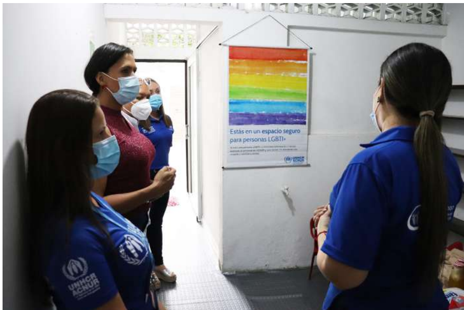
Imagen referencia 47 .